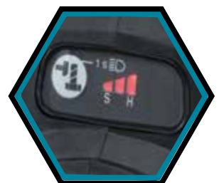
Sélection électronique de la puissance de frappe à 3 niveaux.