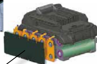
Structure étanche à 3 couches