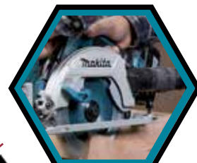
Raccord d'aspiration amovible.