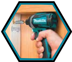
Idéale pour travailler dans les endroits exigus.

Vitesse à vide : 0 - 1'100 / 2'100 / 3'600 t/min Nombre de frappes : 0 - 1'100 / 2'600 / 3'800 frappes/min Porte-outils : 1/4" Couple de serrage dur : 175 Nm Poids avec accu : 1,6 kg