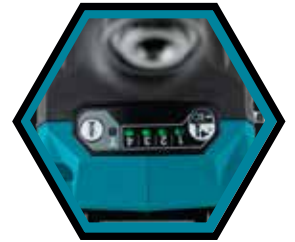
4 modes de serrage + mode T.

Livree avec 2x accus 2.5 Ah, chargeur rapide et coffret de transport