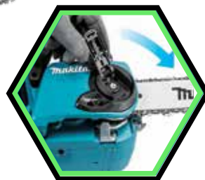
Avec tendeur de chaîne sans outil.