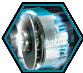
Moteur sans charbon (BL), sans entretien et à longue durée de vie.