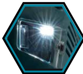
Lumière LED pour l'éclairage de la zone de travail.