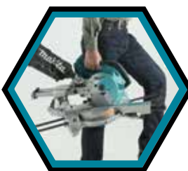
Machine légère et compacte.

Diamètre lame : 190 mm Vitesse à vide : 5'700 t/min Capacité de coupe 90°/45° : 52x300 / 52x212 mm Coupe inclinée 45°G : 40x300 mm Angle d'inclinaison max. D : 45 / 5 ° Coupe onglet max. G : 47 / 57 ° Poids avec accus : 14,7 kg