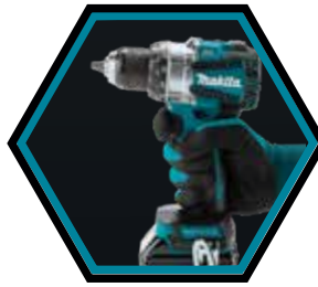
Machine compacte et ergonomique.

Livrée avec 2x accus 5.0 Ah, chargeur rapide et coffret de transport Makpac-B