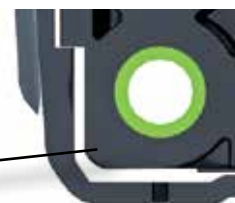
Structure d'absorption des chocs