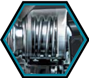
Avec technologie anti-vibration.

Livré avec 2x accus 4.0 Ah, chargeur rapide, butée de profondeur et coffret de transport